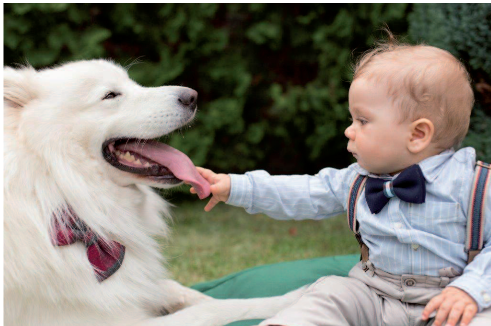
Przyzwyczajanie psa do dziecka